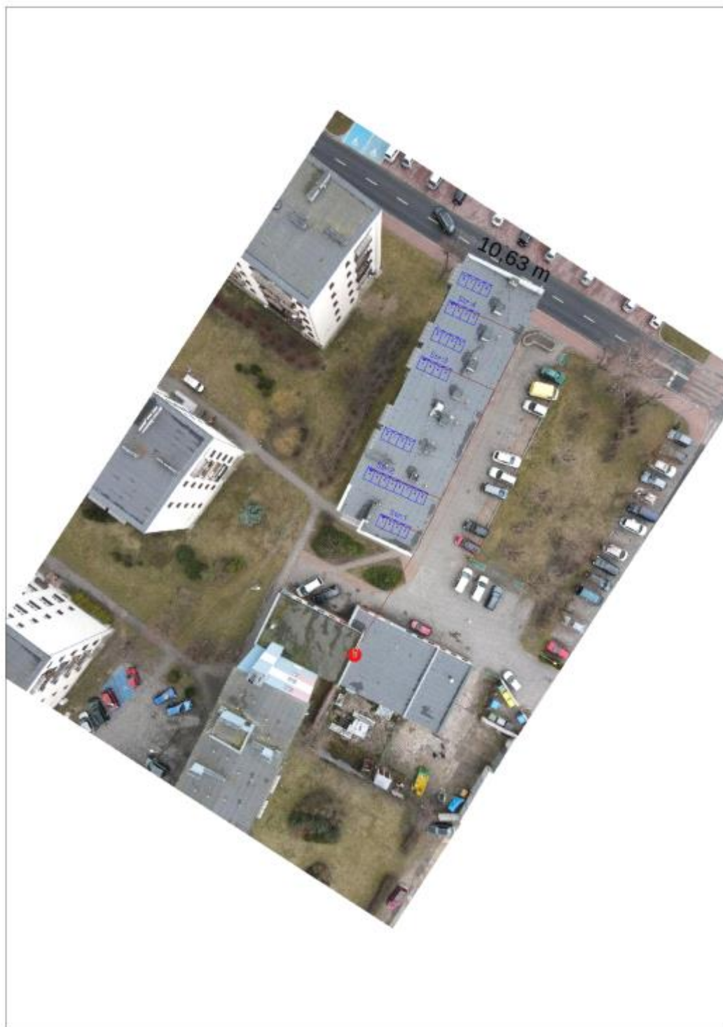
Figura 2: Umieszczenie generatora fotowoltaicznego i grupy konwersji